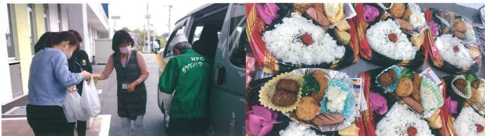
グラウンドワーク笠間による出前サービス