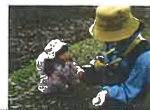
2021年度助成団体「森っこ」

私たちパルシステム茨城 栃木は、日々のくらしの悩みや課題をよりよくしようとする地域に根ざしたグループの活動を応援しています。これまで14年間で延べ180グループの活動に助成してきました。募集は7月スタート！ 私たちと一緒に、暮らしやすい地域づくりに取り組んでいきませんか？